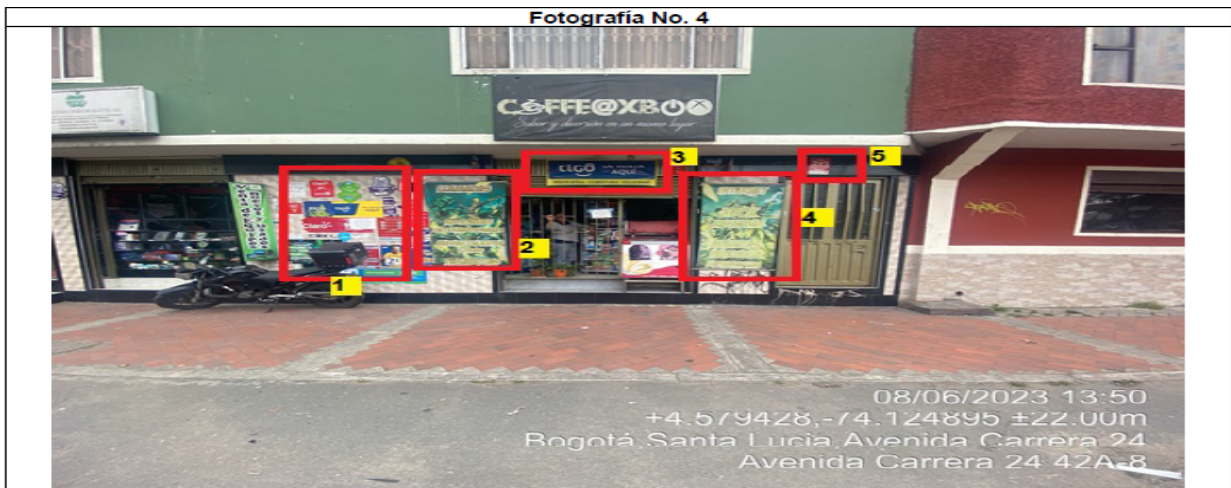
En la cual se evidencian cinco (05) elementos PEV identificados con los números 1, 2, 3, 4 y 5 pertenecientes al establecimiento comercial denominado COFFEE@XBOX, los cuales son adicionales al único elemento permitido por fachada de establecimiento comercial.