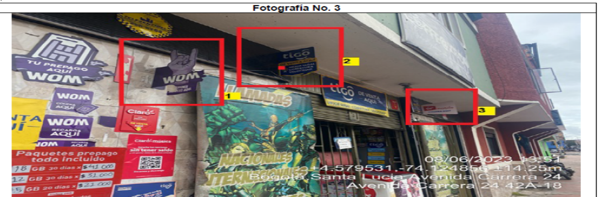
En la cual se evidencian tres (03) elementos PEV identificados con los números 1, 2 y 3 pertenecientes al establecimiento comercial denominado COFFEE@XBOX, los cuales se encuentran volados de la fachada del establecimiento y son adicionales al único elemento permitido.