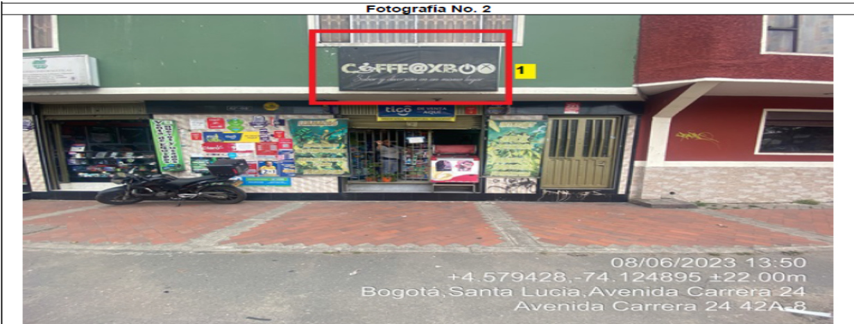
En la cual se evidencia la fachada del establecimiento comercial COFFEE@XBOX, en la que se observa: un (1) elemento publicitario identificado con el número 1, el cual al momento de la visita no contaba con el registro ante la SDA.